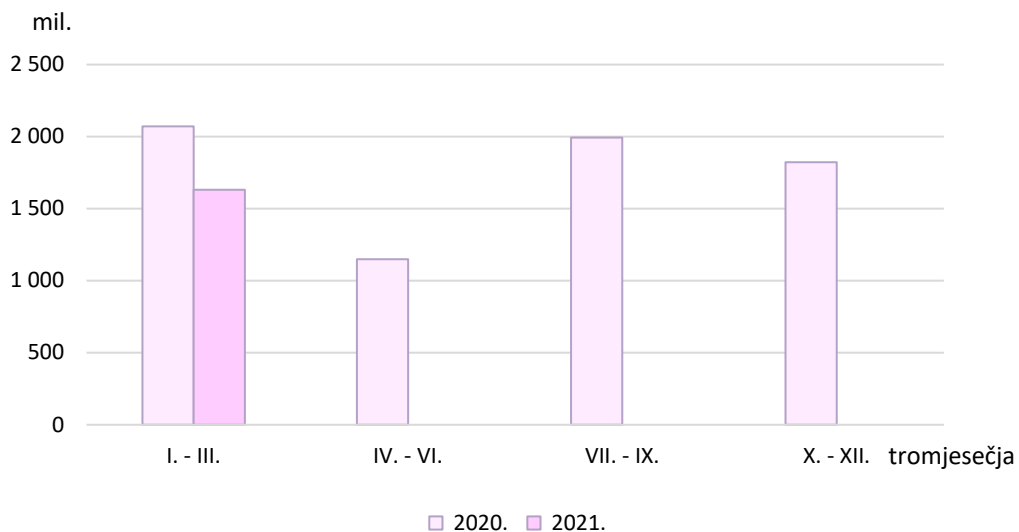
G 1. VRIJEDNOST NOVIH NARUDŽBI GRAĐEVINSKIH RADOVA PO TROMJESEČJIMA 2020. I 2021.